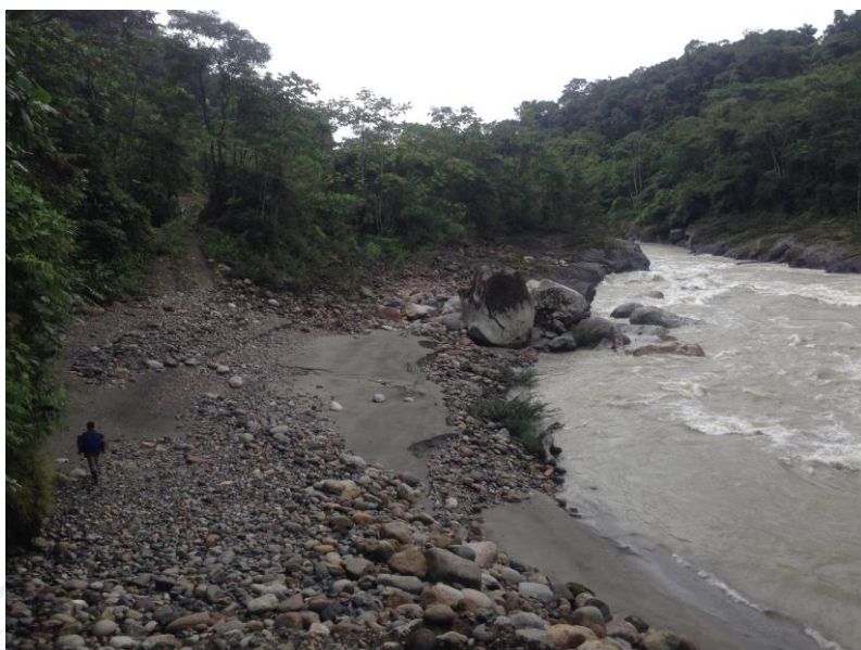
Camino construido de manera ilegal y daños en el margen natural del río Aguarico.