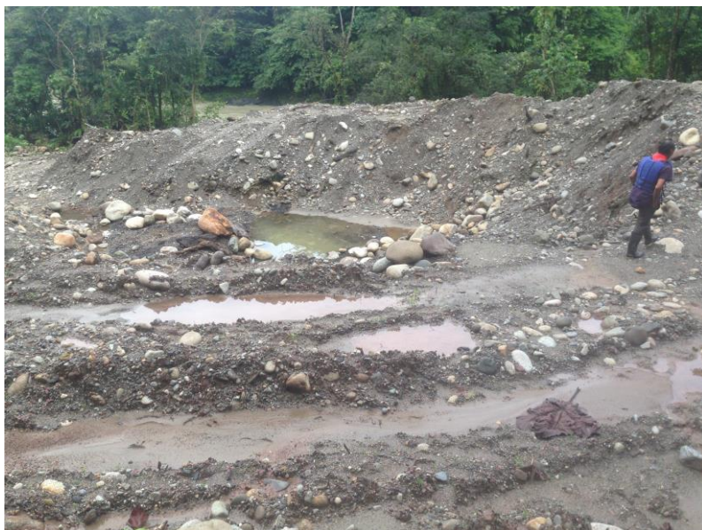
Tala de bosque, ingreso de maquinarias (retroexcavadoras), movimiento de tierras, contaminación del agua, basura. Sector río Chigual.