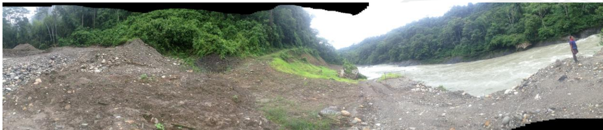
Grandes movimientos de tierra por actividad minera ilegal que afectan el margen del río Aguarico.