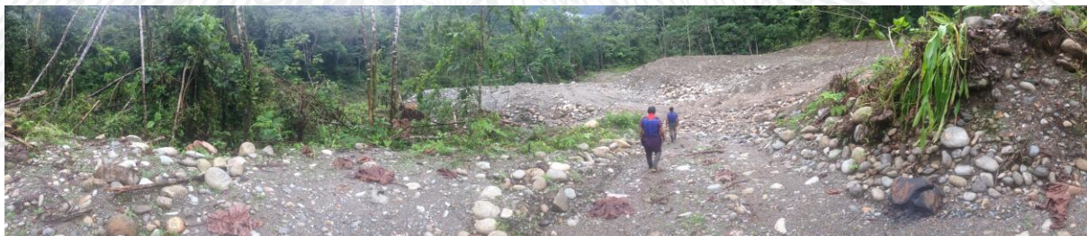
Deforestación, movimiento de tierra, afectación a lugares sagrados kofán.