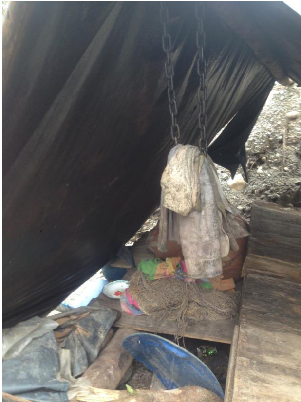
Campamento de mineros ilegales dentro del territorio ancestral kofán.