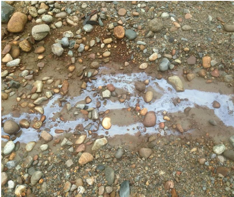
Agua contaminada con hidrocarburos.