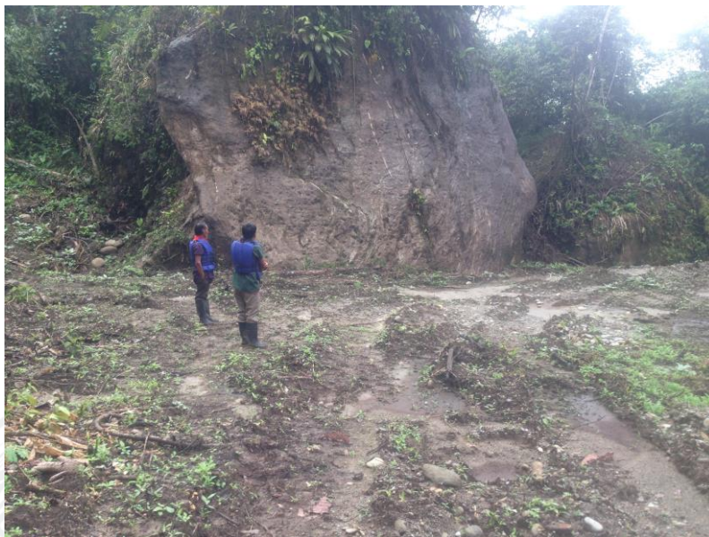
Sitios sagrados afectados por actividad minera realizada con retroexcavadoras.