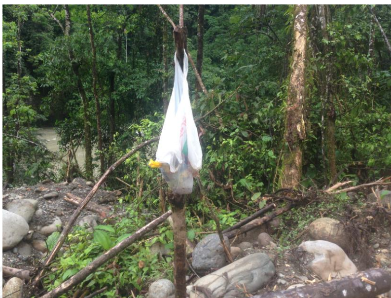
Basura dejada por mineros ilegales.