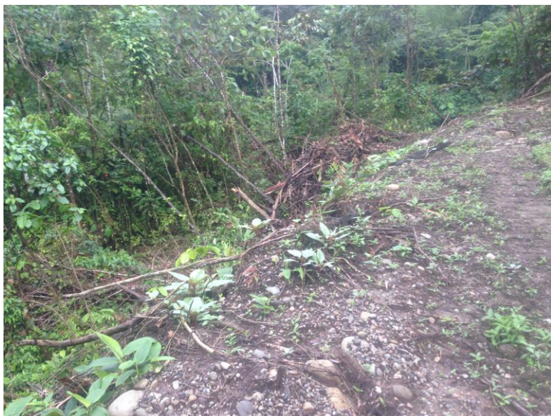
Bosque natural afectado por actividad minera ilegal.