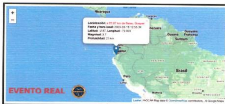
Imagen No. 5:

Que el Instituto Oceanográfico y Antártico de la Armada del Ecuador, con fecha 18 de marzo de 2023, mediante Boletín de Tsunami No. 1 a las 13:07 pm, ha reportado la ocurrencia de un sismo con las siguientes características: magnitud 3,7; latitud -2,87; longitud -79,903; profundidad de 23km, localización 22.87 km de Balao, Guayas 4 ;