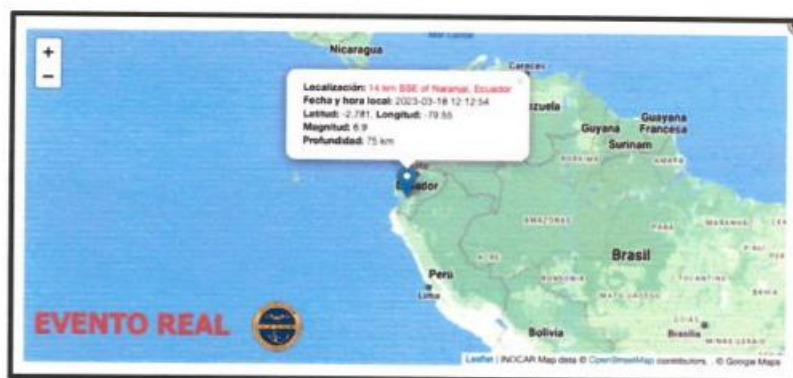
Imagen No. 3:

Que el Instituto Oceanográfico y Antártico de la Armada del Ecuador, con fecha 18 de marzo de 2023, mediante Boletín de Tsunami No. 1 a las 12:22 pm y Boletín de Tsunami No. 2 a las 12:26 pm, ha reportado la ocurrencia de un sismo con las siguientes características: magnitud 6,9; latitud -2,781; longitud -79,55; profundidad de 75 km, localización 14 km SSE de Naranjal. Ecuador 2 ;