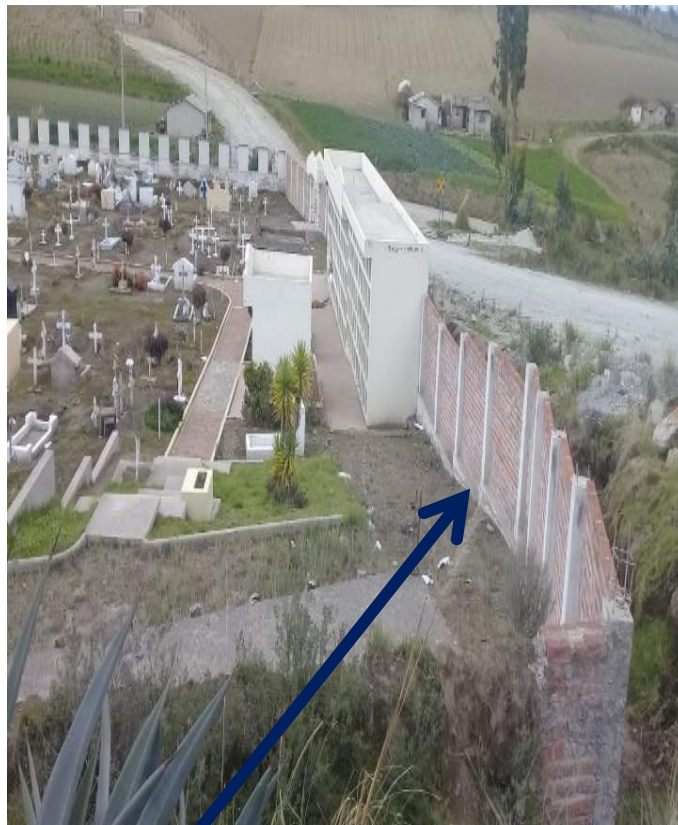
Pared de ladrillo, en propiedad privada