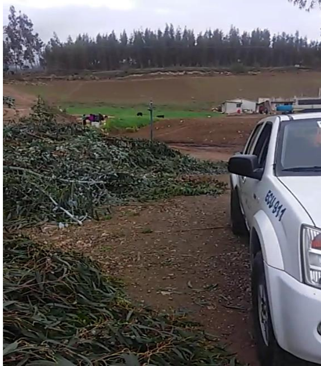
Patrullero de la Policía Nacional