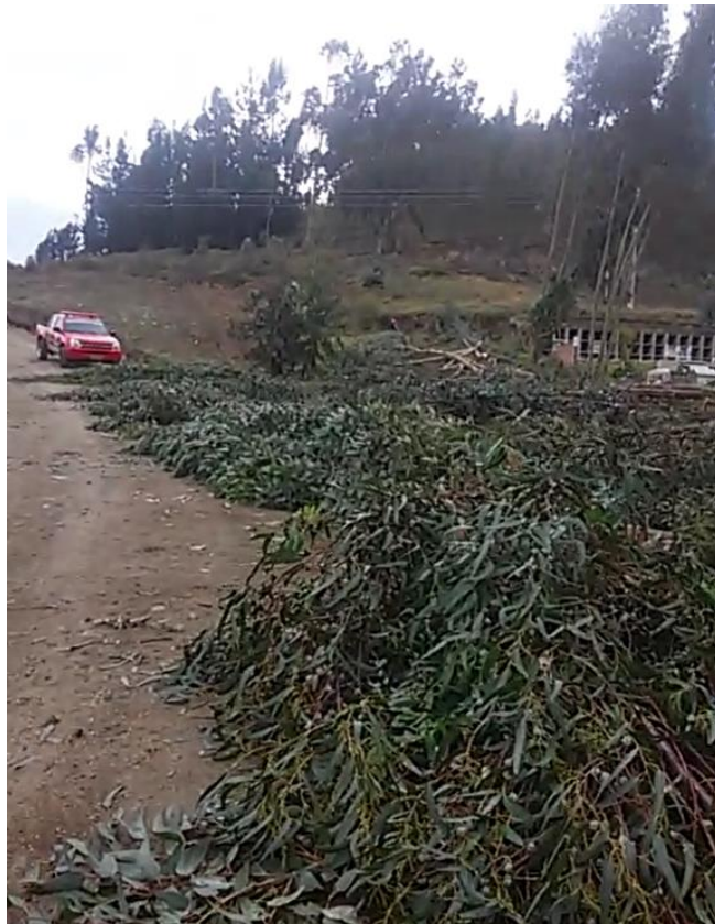
Destrucción de la naturaleza y vehículo del cuerpo de bomberos de Colta