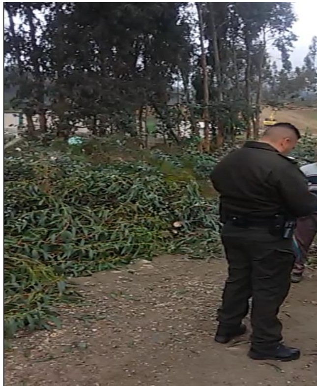
Policía Nacional en el procedimiento