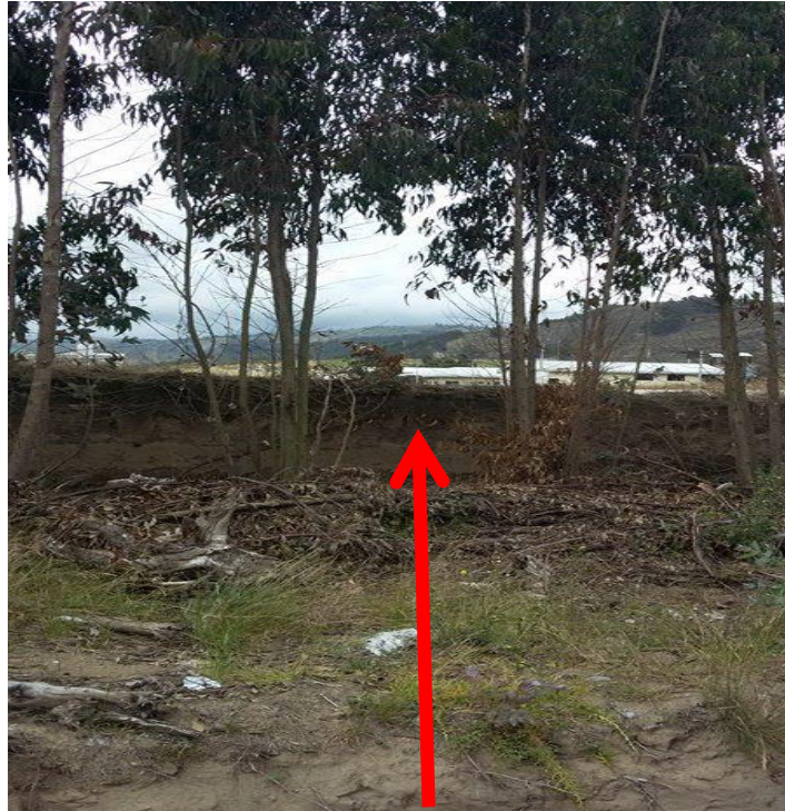
Pared de tierra o tapial (lindero oeste 68.80 metros)