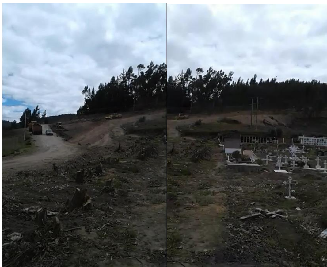
Huella ecológica del daño a la naturaleza

10) El Gobierno Municipal de Colta, fue sancionado administrativamente por el Ministerio de Ambiente, según el siguiente detalle: