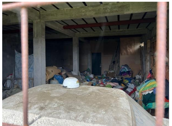
Anexo fotográfico 4