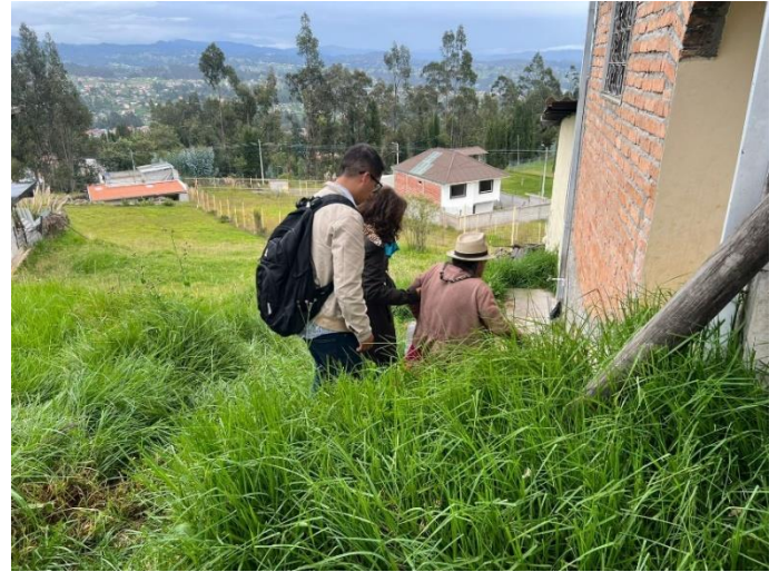
Anexo fotográfico 6