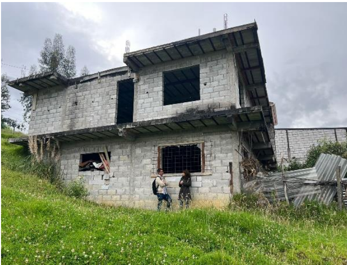
Anexo fotográfico 3