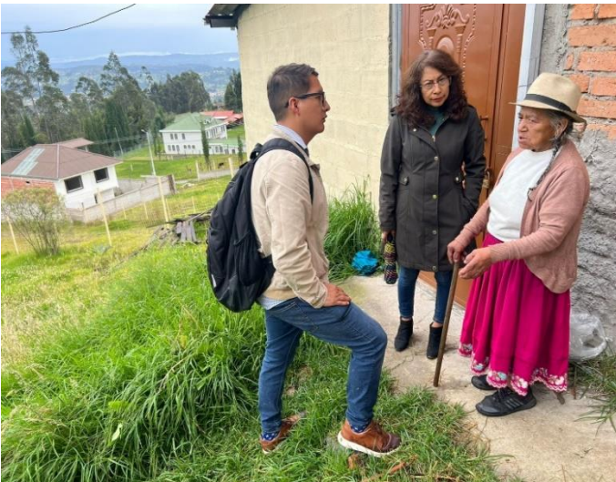
Anexo fotográfico 7