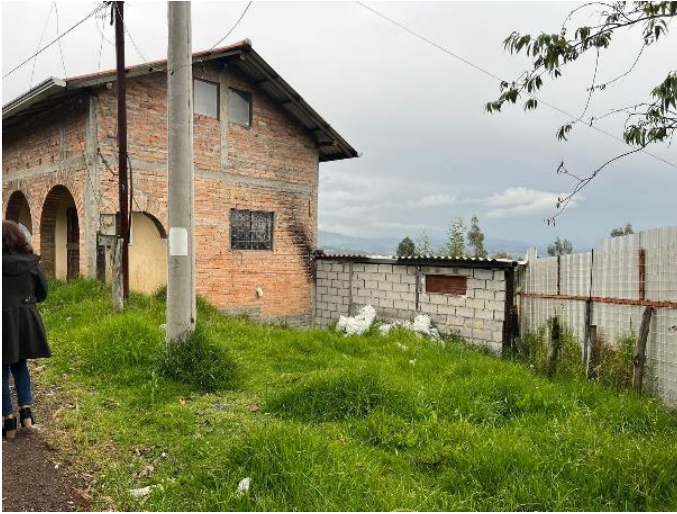
Anexo fotográfico 1