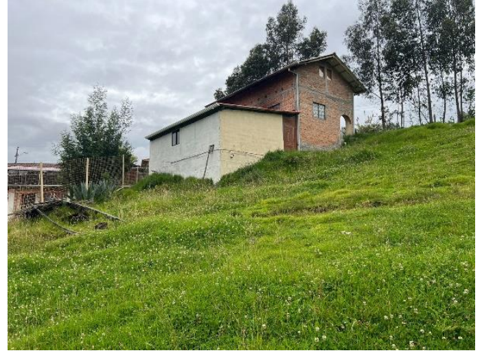
Anexo fotográfico 2