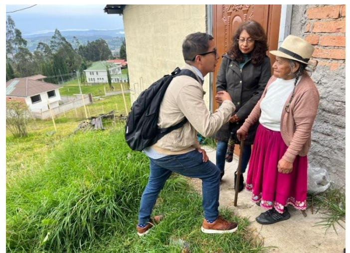
Anexo fotográfico 8