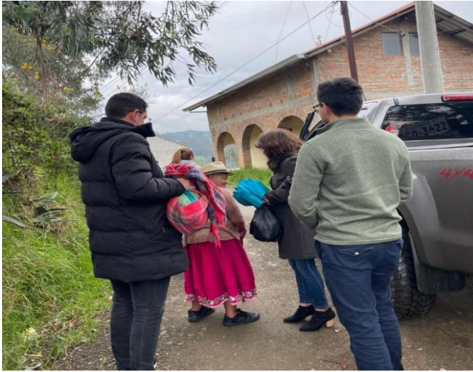
Anexo fotográfico 5