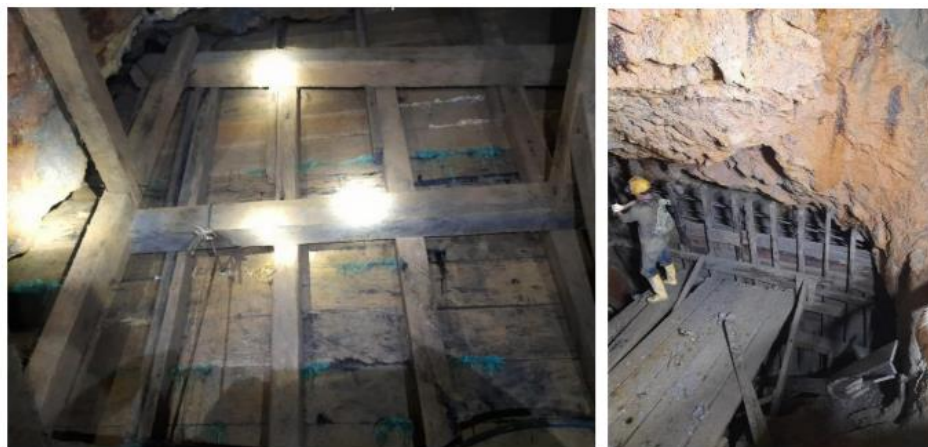
Encofrados apuntalados, aguas abajo (izq) y aguas arriba (der) del tapón de hormigón armado

El encofrado del tapón es de madera de la localidad de Zaruma y tiene como función contener el hormigón de la fundición, primero se construyó el encofrado aguas abajo a partir del 25 de enero del año en curso. Tiene que ser drenado permanentemente con mangueras para evitar acumulación de agua durante el proceso de fundición. El otro encofrado del tapón es aguas arriba y aunque tiene función similar en cuanto a soportar el peso del hormigón armado, tiene que ser construido y levantado desde la base conforme avanza la fundición del tapón.