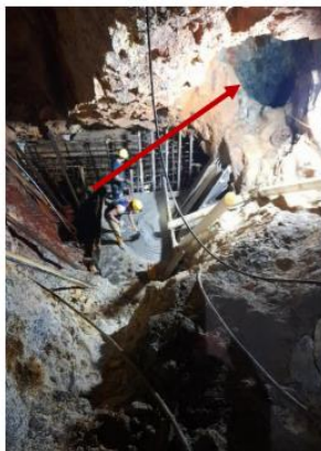
Figura 1. Ubicación de by pass para salida de emergencia