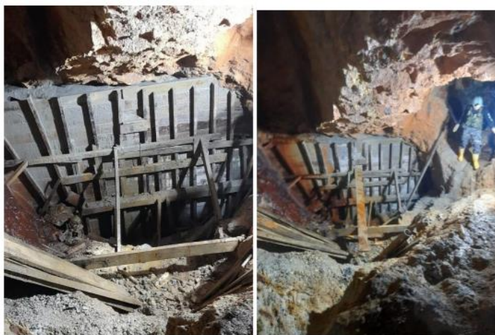
Tapón 1 fundido total y monitoreo a las 48 horas (derecha) sin novedad

Etapa 1: 7 m 3 Etapa 2: 7 m 3 Etapa 3: 4 m 3