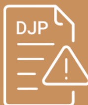
DECLATORIA JURISDICCIONAL PREVIA

Sentencia con declaratoria jurisdiccional previa: Se tratan de aquellas decisiones en las cuales la Corte Constitucional, luego de realizar una revisión exhaustiva del expediente y escuchar los fundamentos de las autoridades judiciales, observa que las y los jueces que conocieron las acciones de garantías jurisdiccionales en última instancia incurrieron en error inexcusable y/o manifiesta negligencia.