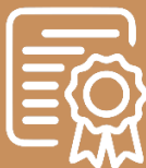
SENTENCIA DE MÉRITO

Sentencia de mérito: Es una decisión dictada en una acción extraordinaria de protección (EP), proveniente de una garantía jurisdiccional, que cumple con los presupuestos específicos delineados en las sentencias 176-14-EP/19 y 2137-21-EP/21 1 , para resolver los hechos y pretensiones que dieron lugar al conflicto de origen, además de revisar la actuación judicial del operador de justicia que dictó la decisión impugnada.