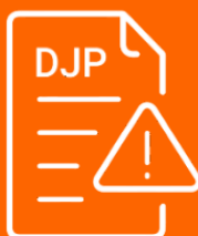
DECLATORIA JURISDICCIONAL PREVIA

Sentencia con declaratoria jurisdiccional previa: Se tratan de aquellas decisiones en las cuales la Corte Constitucional, luego de realizar una revisión exhaustiva del expediente y escuchar los fundamentos de las autoridades judiciales, observa que las y los jueces que conocieron las acciones de garantías jurisdiccionales en última instancia incurrieron en error inexcusable y/o manifiesta negligencia.