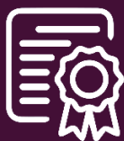
SENTENCIA DE MÉRITO

Sentencia de mérito: Es una decisión dictada en una acción extraordinaria de protección (EP), proveniente de una garantía jurisdiccional, que cumple con los presupuestos específicos delineados en las sentencias 176-14-EP/19 y 2137-21-EP/21 1 , para resolver los hechos y pretensiones que dieron lugar al conflicto de origen, además de revisar la actuación judicial del operador de justicia que dictó la decisión impugnada.