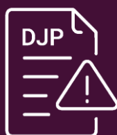
DECLARATORIA JURISDICCIONAL PREVIA

Sentencia con declaratoria jurisdiccional previa: Se tratan de aquellas decisiones en las cuales la Corte Constitucional, luego de realizar una revisión exhaustiva del expediente y escuchar los fundamentos de las autoridades judiciales, observa que las y los jueces que conocieron las acciones de garantías jurisdiccionales en última instancia incurrieron en error inexcusable y/o manifiesta negligencia.