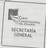
AIDA SOLEDAD GARCIA BERNI SECRETARÍA GENERAL DE LA CORTE CONSTITUCIONAL