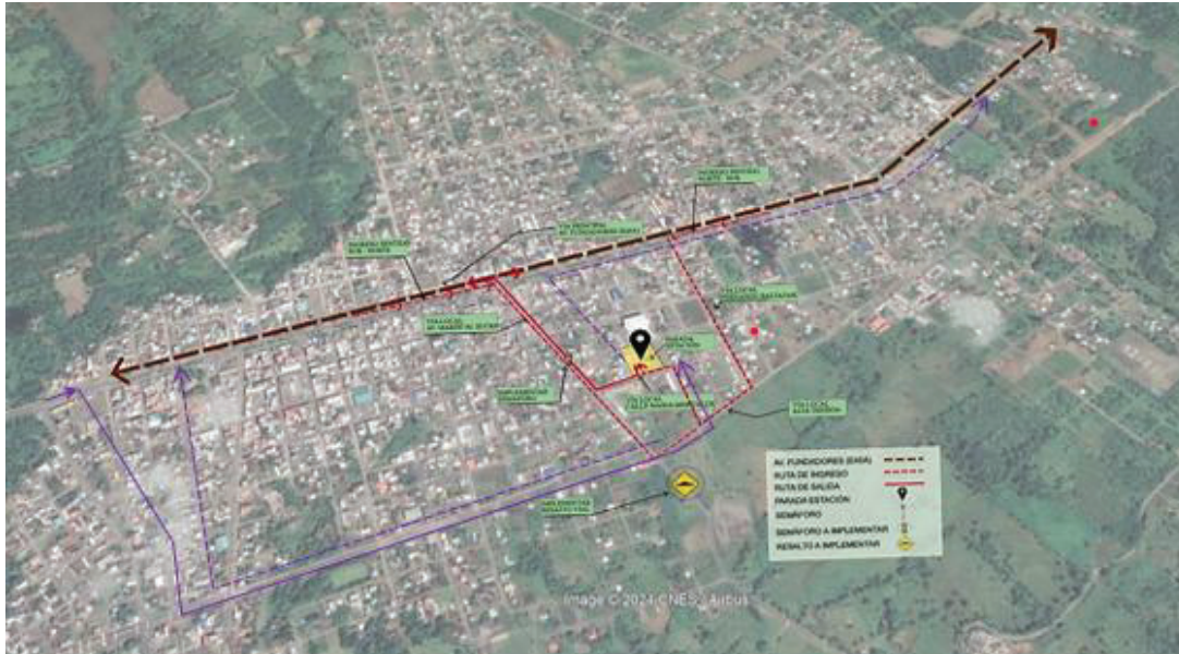
Ilustración N° 2 Gráfico de rutas.

Artículo 60. Excepciones a la obligatoriedad de ingreso a la Parada de Embarque y Desembarque de Pasajeros. - Se exceptúan de la obligación de ingresar a la Parada de Embarque y Desembarque de Pasajeros del cantón La Joya de los Sachas, los vehículos de transporte terrestre que cumplan con alguna de las siguientes condiciones: