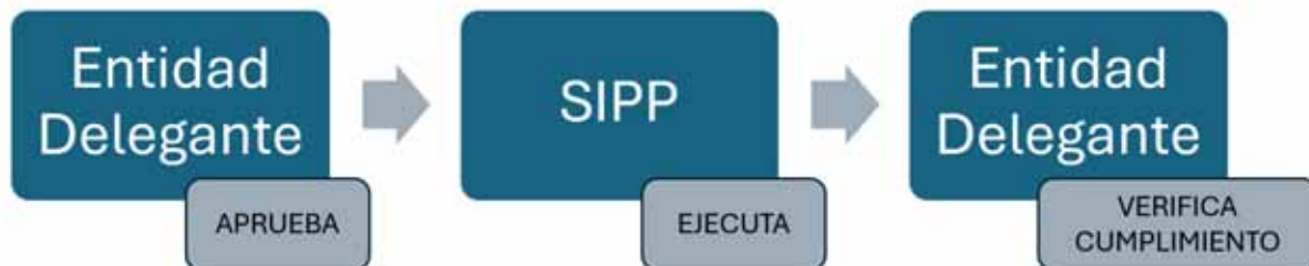
Gráfico 2: Responsabilidades de las Entidades Delegantes y la SIPP en el ámbito de la Administración Pública Central