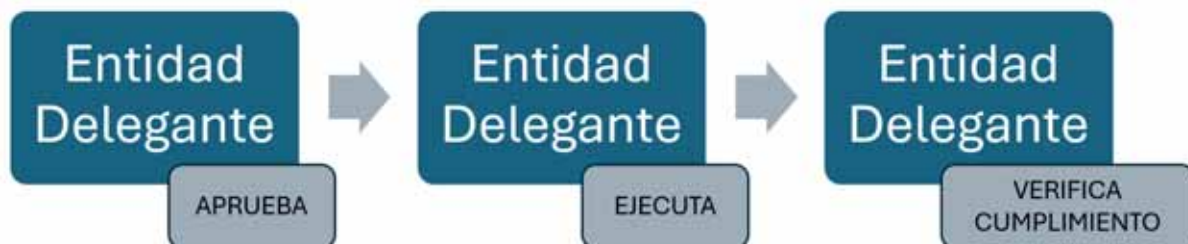
Gráfico 3: Responsabilidades de las Entidades Delegantes que no pertenecen a la Administración Pública Central