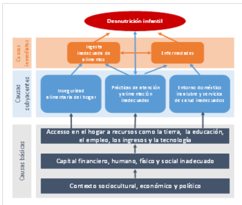
Figura 1: Factores causales de la desnutrición infantil