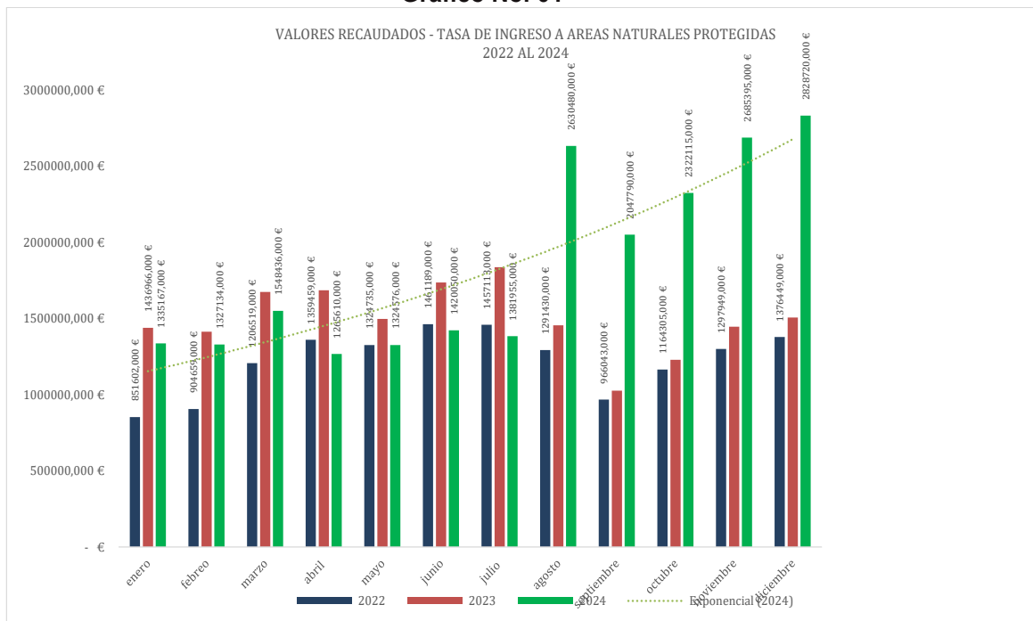
Gráfico No. 01