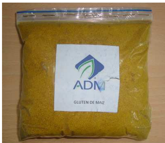
Imagen obtenida de la muestra adjunta al oficio de Consulta