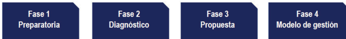
Ilustración 1. Fases guías PDOT

Elaboración: Secretaría Nacional de Planificación, 2023.