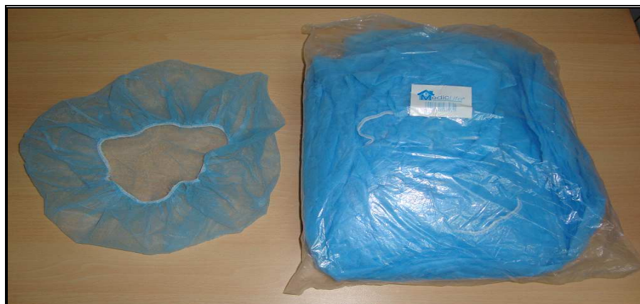
Imagen obtenida de la muestra adjunta al Oficio de Consulta