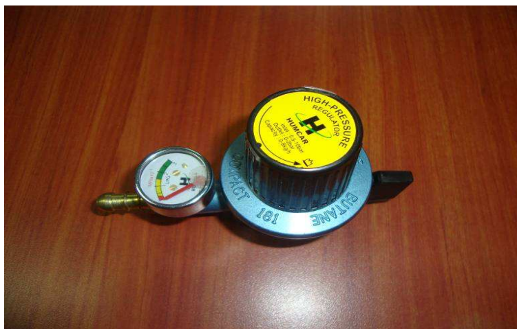
Imagen obtenida de la muestra adjunta al oficio de Consulta