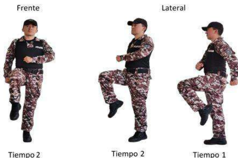
Imagen 10.- Marquen paso.