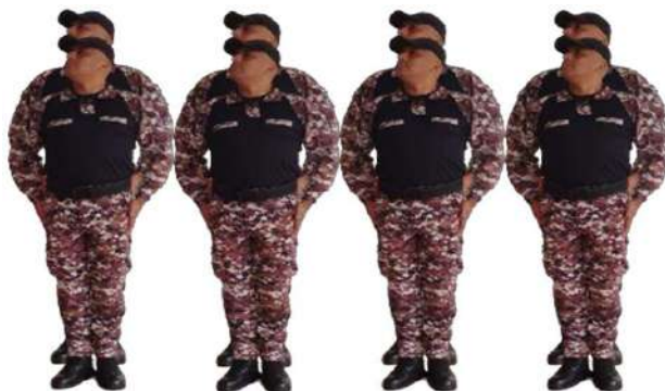
Imagen 3629.- Honores procedimiento.

Artículo 92.- Honores sobre la marcha.- Se ejecutan cuando las unidades se encuentran desplazándose en formación.