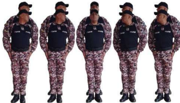
Imagen 30.- Voz preventiva 2