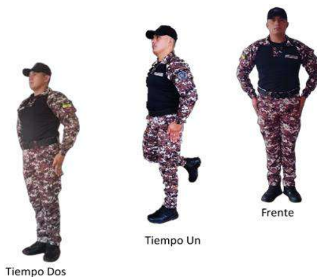
Imagen 8.- A medio derecha