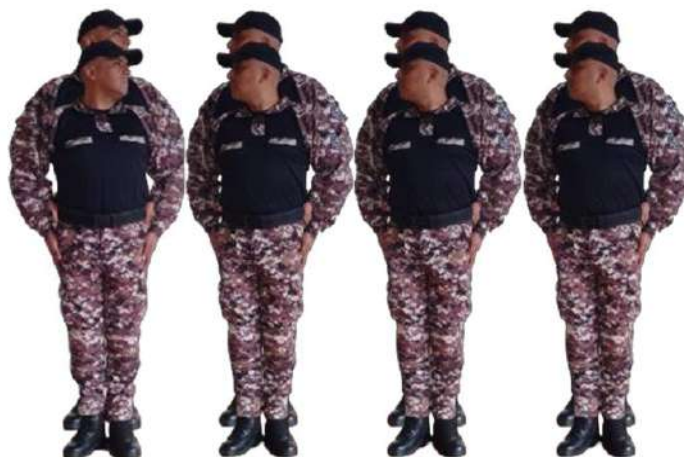
Imagen 145.- Vista voz preventiva.