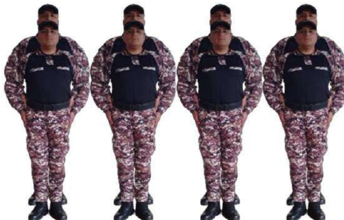
Imagen 193.- Normal voz ejecutiva 2.