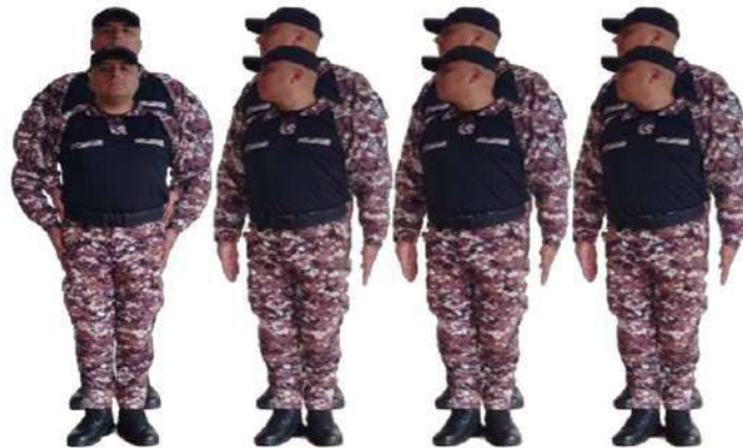
Imagen 160.- Normal voz preventiva 1.