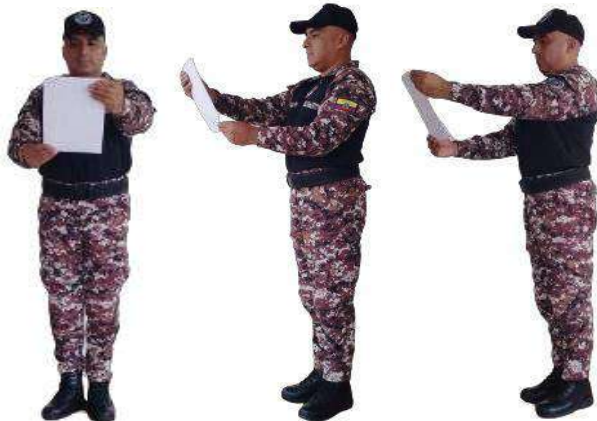
Imagen 38.- Lectura de la Orden del Cuerpo.