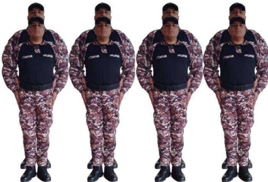
Imagen 156.- Vista voz ejecutiva.