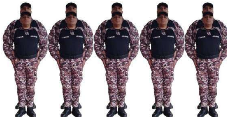
Imagen 263.- Línea.