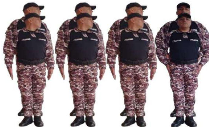
Imagen 204.- Eventual voz preventiva 1.