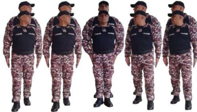
Imagen 29.- Voz ejecutiva 1.