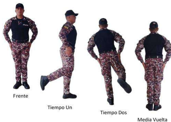
Imagen 6.- Media vuelta.