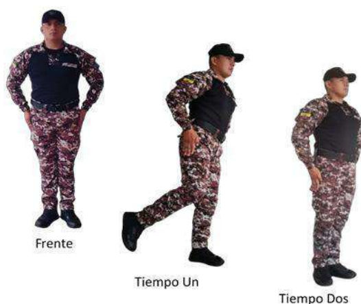
Imagen 7.- A medio izquierdo.