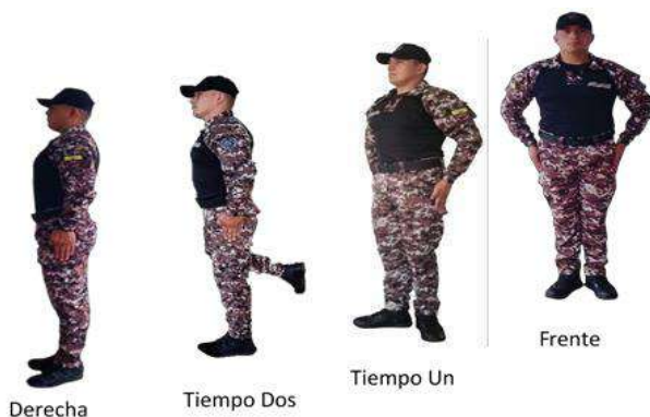
Imagen 5.- A la derecha.