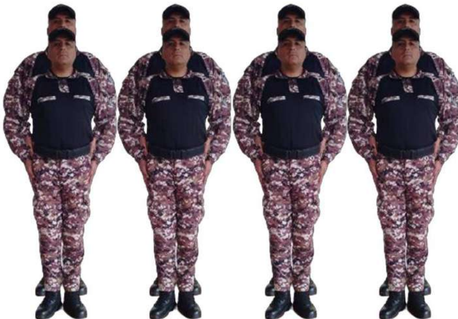
Imagen 2723.- Eventual voz ejecutiva 2.