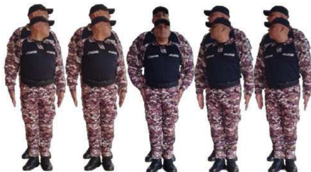
Imagen 28.- Por guías voz preventiva 1.