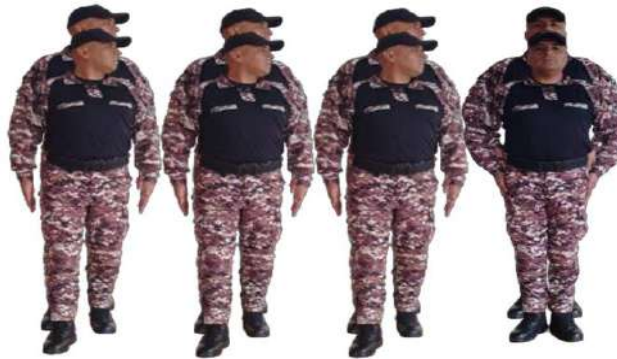
Imagen 215.- Eventual voz ejecutiva 1.