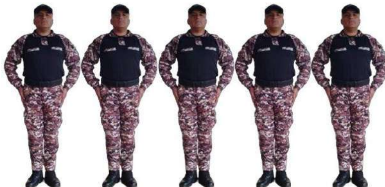
Imagen 252.- Fila.