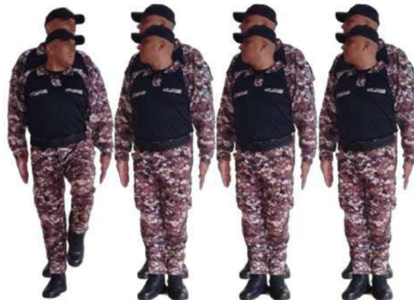
Imagen 18.- Pie voz ejecutiva 1.