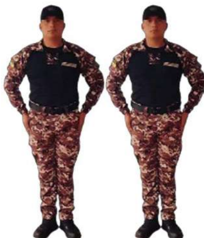
Imagen 12.- Binomio.