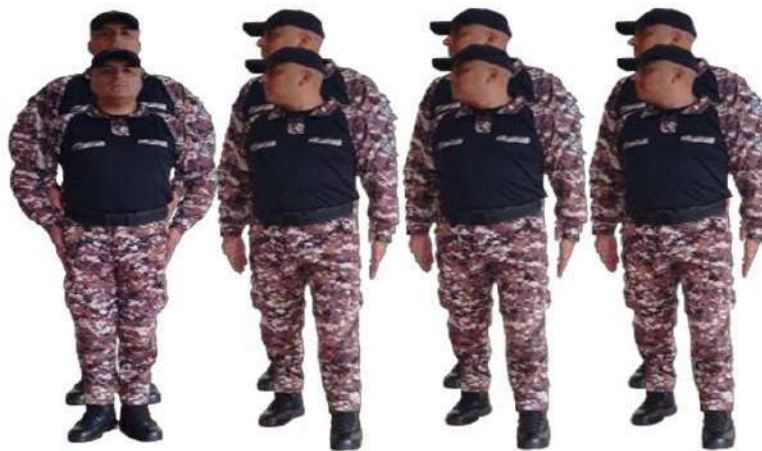
Imagen 171.- Normal voz ejecutiva 1.