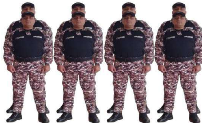
Imagen 19.- Pie voz ejecutiva 2.