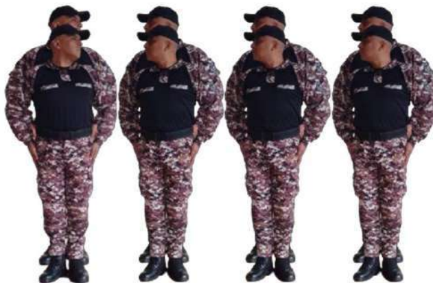
Imagen 17.- Pie voz preventiva.