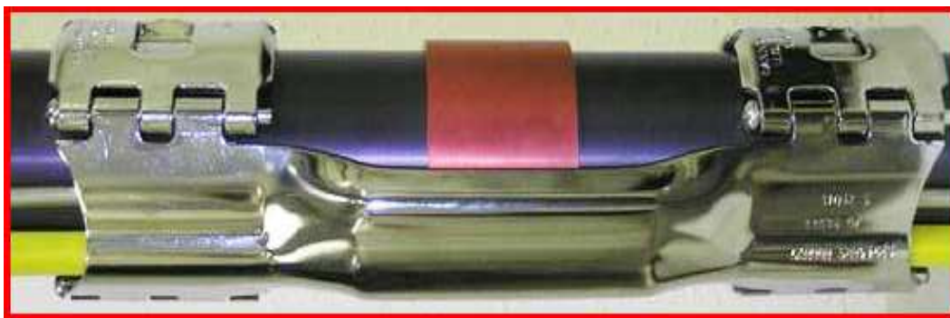
Imagen tomada del catálogo adjunto al oficio de Consulta de Aforo - H/T No. 10-01-SEGE-01083

Las características técnicas señaladas en el cuadro precedente, obtenidas de la información adjunta al oficio de consulta, así como la información contenida en el catálogo del producto indican que el producto denominado comercialmente como “Protectores de Cable para Explotación y Sondeo de la Industria Petrolera” , es de estricto uso de las máquinas utilizadas para el Sondeo, perforación y/o explotación de Pozos petroleros, clasificadas arancelariamente en las subpartidas arancelarias 8430.41.00.00 ó 8430.49.00.00 según el tipo de máquina que corresponda. Esta mercancía, gracias a su estructura de acero, ayuda a proteger de la presión a los cables introducidos a miles de pies durante las exploraciones de la industria petrolera.